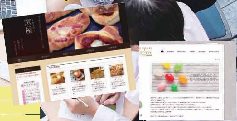
↑受講生作品 / 実践的なWEBサイト制作実習を行います。

未経験でも大丈夫！ WEB関連の就職で必要とされる 専門スキルを基礎から丁寧に学習。 実践的なWEBサイト制作ができる ようになる！就職に有利！！